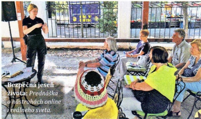
Bezpečná jeseň života: Prednáška o nástrahách online i reálneho sveta.